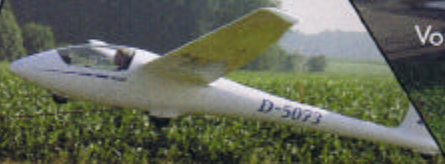
Abheben zum Windenstart